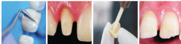
Phục hồi trực tiếp